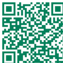
Site du Parc Loire-Anjou-Touraine

Consultez le dossier complet, retrouvez tous les lieux d'enquête, les dates des permanences et autres informations en ligne.